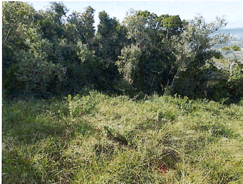
Foto 4 - Área desmatada.