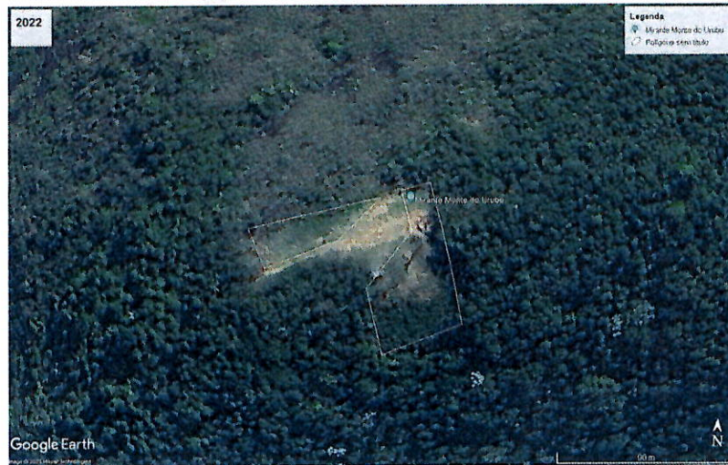
Foto 1 - Vegetação antes do desmate.