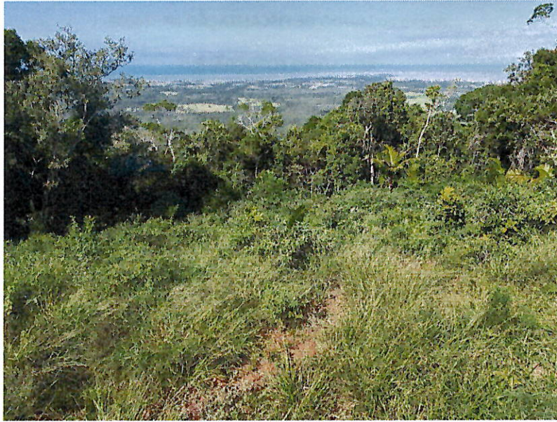
Foto 3 - Área desmatada.