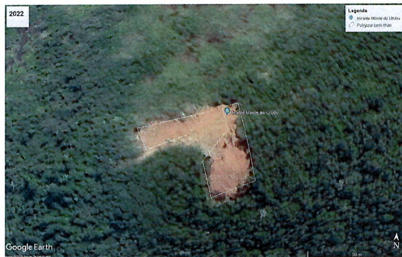
Foto 2 - Desmatamento.